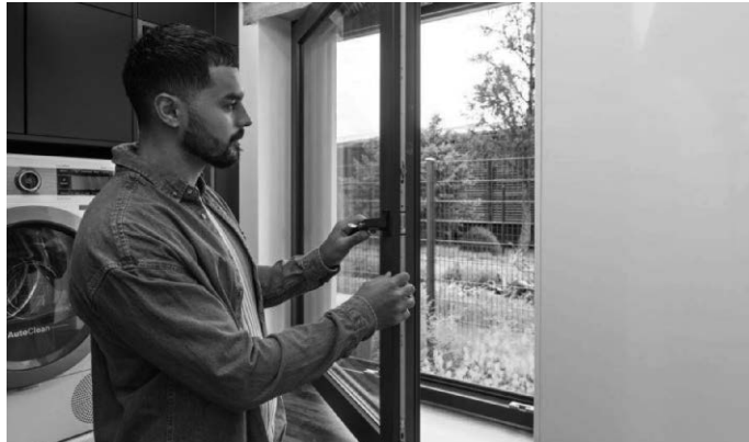
Wärmeschutzfenster verhindern Wärmeverluste im Winter.

Wenn ein Luftzug spürbar ist oder Wasser eindringt, sollten Hauseigentümerinnen und Hauseigentümer ihre alten Fenster zeitnah austauschen. Auch Tauwasser am Glas oder trübe Scheibeninnenräume sind Anzeichen dafür, dass eine Erneuerung sinnvoll ist. Auch wenn die Fenster beim Öffnen und Schließen häufig klemmen, ist das ein Indiz. Dies gilt insbesondere dann, wenn die Fenster älter als 20 Jahre sind. Hauseigentümerinnen und Hauseigentümer sollten darauf achten, dass neue Fenster fachgerecht eingebaut werden. Gebäudeenergieberater und Fensterbaubetriebe sind kompetente Ansprechpartner rund um den Einbau. Die Beratung durch Experten lohnt sich auch finanziell: Die KfW genehmigt eine finanzielle Förderung nur dann, wenn eine Fachperson den geplanten Einbau neuer Fenster anmeldet und die energetischen Anforderungen dabei erfüllt werden.